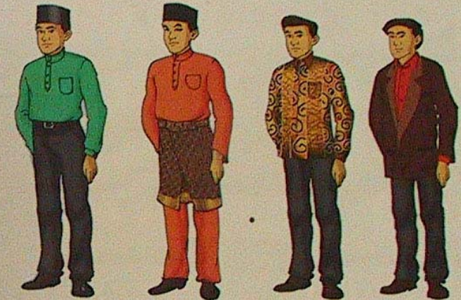
CONTOH PAKAIAN LELAKI YANG DIBENARKAN